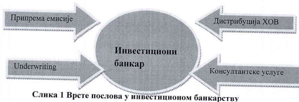
Слика 1 Врсте послова у инвестиционом банкарству